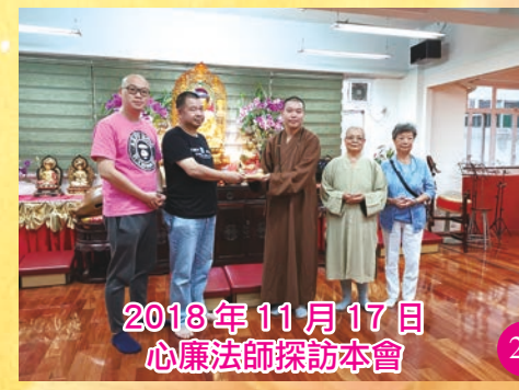
2018年11月17日 心廉法師探訪本會