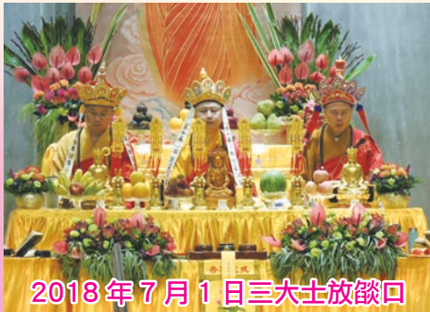
2018 年 7 月 1 日三大士放焰口