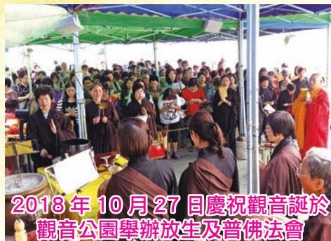
2018年10月27日慶祝觀音誕於 觀音公園舉辦放生及普佛法會