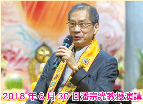
2018 年 6 月 30 日潘宗光教授演講