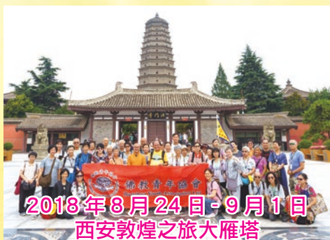
2018年8月24日-9月1日 西安敦煌之旅大雁塔