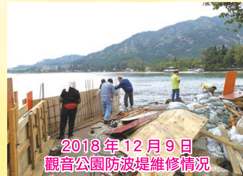
2018年12月9日 觀音公園防波堤維修情況