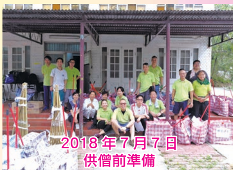
2018年7月7日 供僧前準備