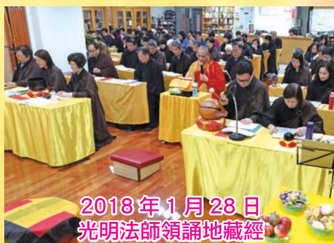
2018年1月28日 光明法師領誦地藏經