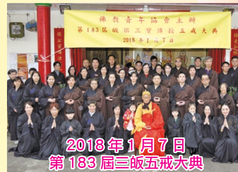
2018年1月7日 第183屆三皈五戒大典