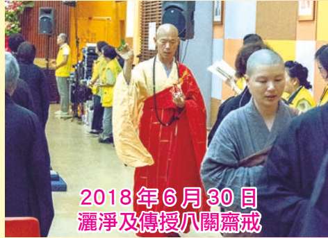
2018 年 6 月 30 日 灑淨及傳授八關齋戒