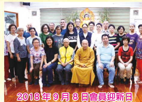
2018年9月8日會員迎新日