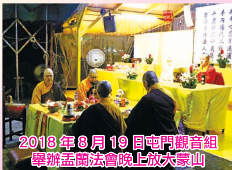
2018年8月19日屯門觀音組 舉辦盂蘭法會晚上放大蒙山