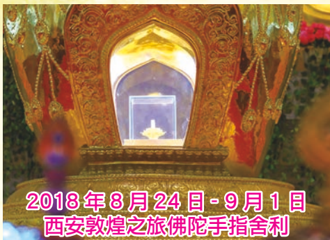
2018年8月24日-9月1日 西安敦煌之旅佛陀手指舍利