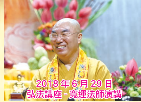
2018 年 6 月 29 日 弘法講座 - 寬運法師演講