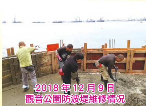
2018年12月9日 觀音公園防波堤維修情況