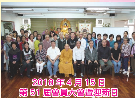
2018年4月15日 第51屆會員大會暨迎新日