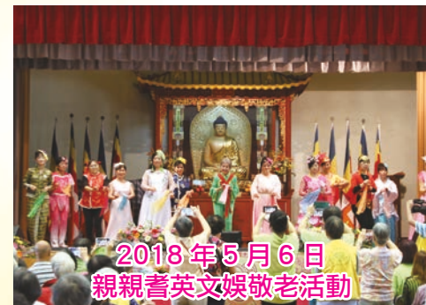
2018年5月6日 親觀耆英文娛敬老活動