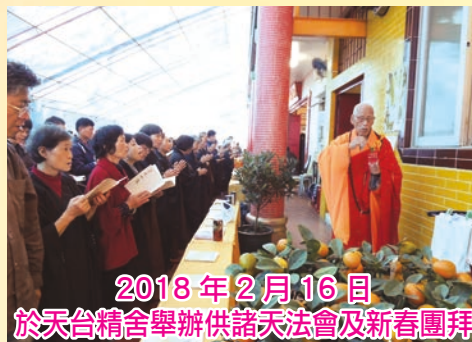
2018年2月16日 於天台精舍舉辦供諸天法會及新春團拜