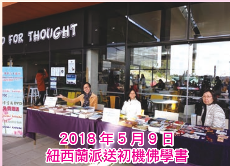
2018年5月9日 紐西蘭派送初機佛學書