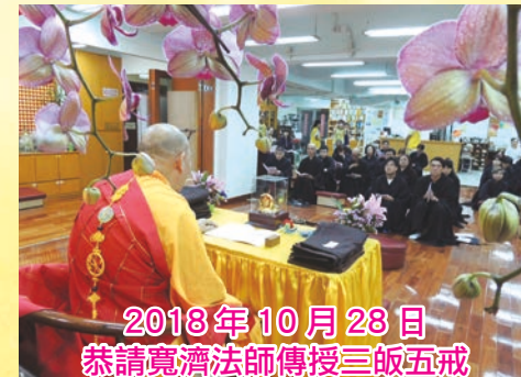
2018年10月28日 恭請寬濟法師傳授三皈五戒