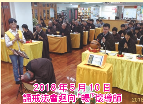
2018年5月10日 誦戒法會迴向暢下懷導師