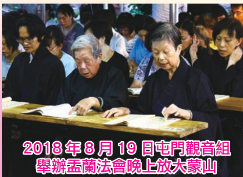
2018年8月19日屯門觀音組 舉辦盂蘭法會晚上放大蒙山