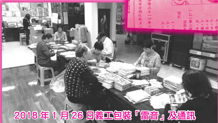
2018年1月26日義工包裝「雷音」及通訊

本會於一九六八年創立，並於同年的十二月十五日創立會刊，定名《雷音》。天上的積雨雲對流旺盛時會引放電流，產生電光和雷聲；尤如本會一班義工，積極而熱熾地並肩走在護持正法的路，引發光芒，引發轟鳴雷聲，故刊物以《雷音》定名。 第一期《雷音》由上暢下懷法師擔任督刊兼出版人，實行以文字作為傳送佛教精神的媒體。《雷音》的內容以佛教大德的各類文章為主。目的是期望會員在百忙的生活中，能透過定期接收這結緣刊物，領受佛教大德的薰陶。雷音亦以照片型式介紹本會各類以佛教精神為宗旨的活動。