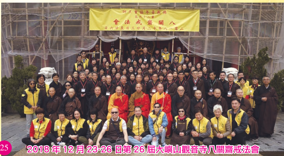
2018年12月23-26日第26屆大嶼山觀音寺八關齋戒法會