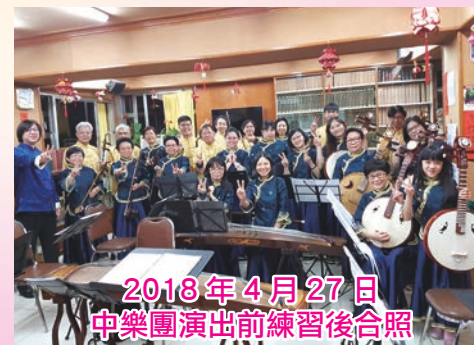
2018年4月27日 中樂團演出前練習後合照