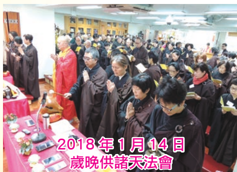
2018年1月14日 歲晚供諸天法會