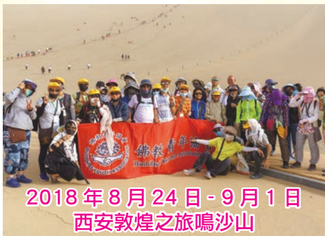
2018年8月24日-9月1日 西安敦煌之旅鳴沙山