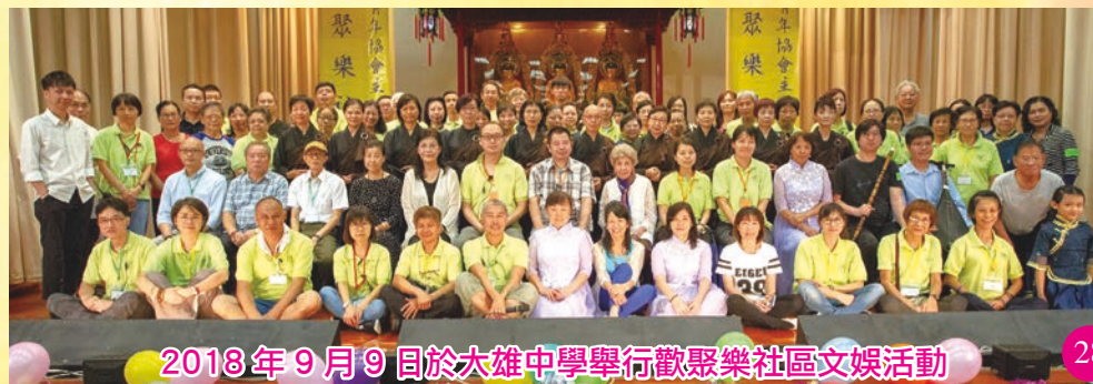
2018年9月9日於大雄中學舉行歡聚樂社區文娛活動