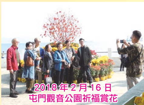
2018年2月16日 屯門觀音公園祈福賞花