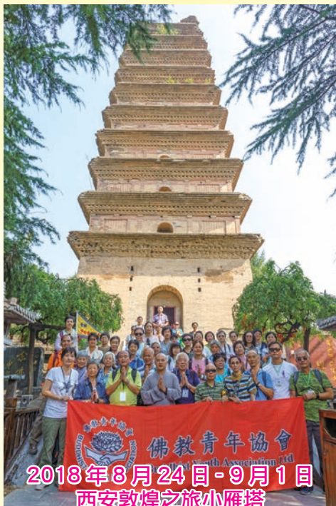
2018年8月24日-9月1日 西安敦煌之旅小雁塔