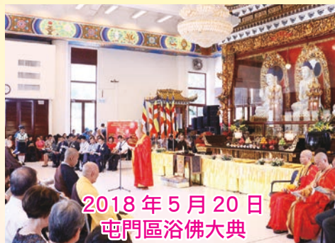
2018年5月20日 屯門區浴佛法典