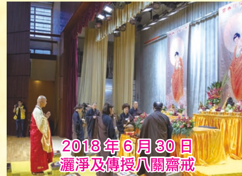
2018 年 6 月 30 日 灑淨及傳授八關齋戒