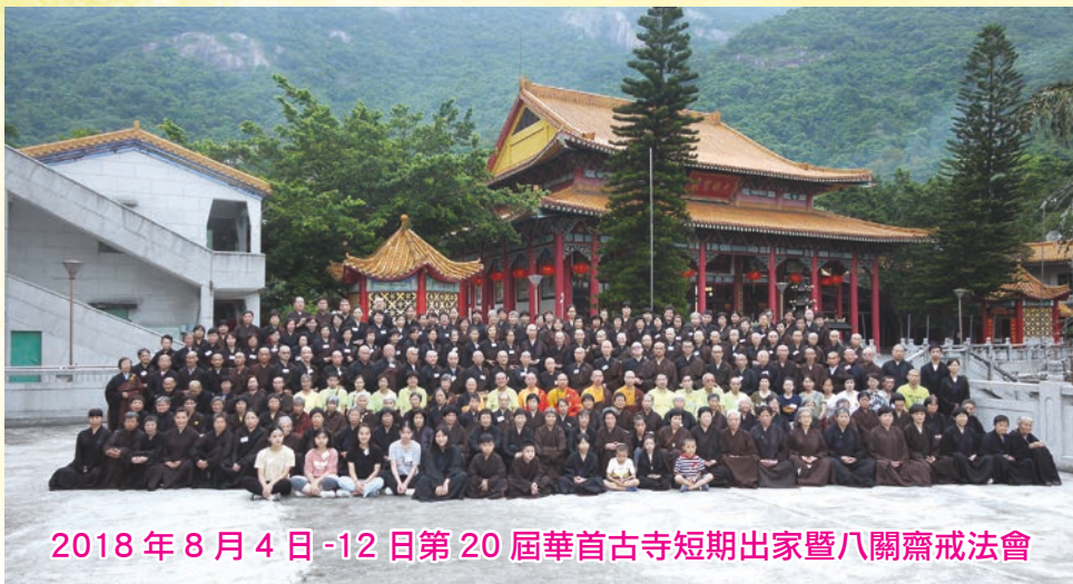
2018年8月4日-12日第20屆華首古寺短期出家暨八關齋戒法會