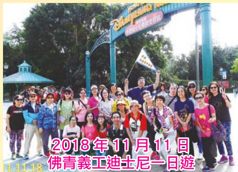
2018年11月11日 佛青義工迪士尼一日遊