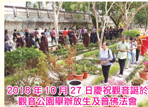
2018年10月27日慶祝觀音誕於 觀音公園舉辦放生及普佛法會