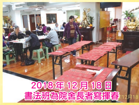
2018年12月18日 書法班為院舍長者寫揮春