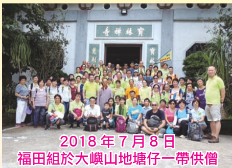
2018年7月8日 福田組於大嶼山地塘仔一帶供僧