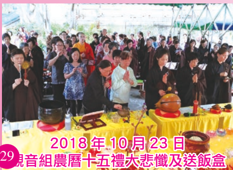
2018年10月23日 觀音組農曆十五禮大悲懺及送飯盒