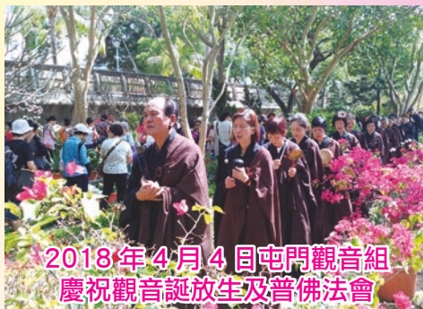
2018年4月4日屯門觀音組 慶祝觀音誕放生及普佛法會