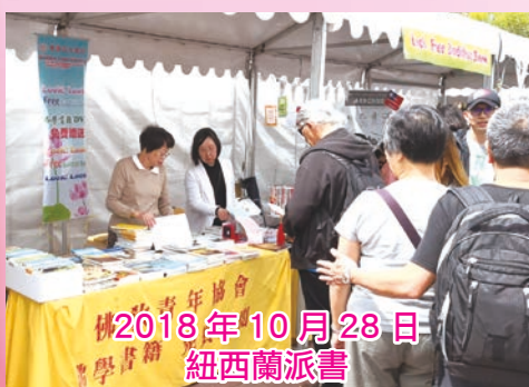
2018年10月28日 紐西蘭派書