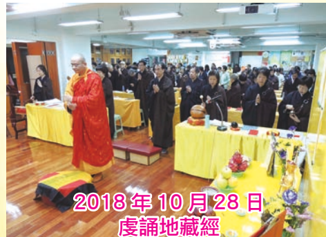
2018年10月28日 虔誦地藏經