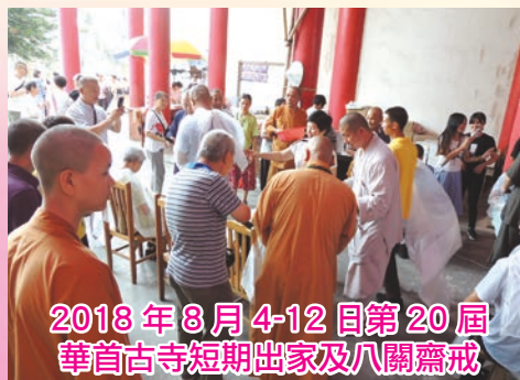
2018年8月4-12日第20屆 華首古寺短期出家及八關齋戒