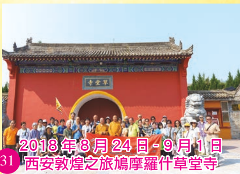
2018年8月24日-9月1日 西安敦煌之旅鳩摩羅什草堂寺