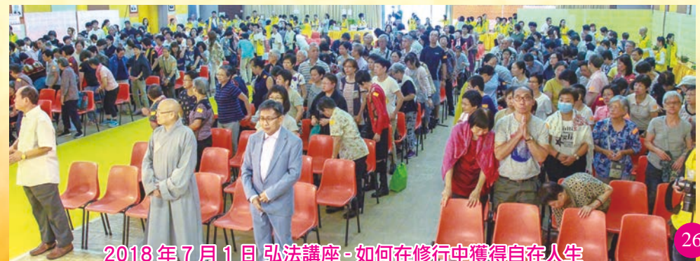
2018 年 7 月 1 日弘法講座 - 如何在修行中獲得自在人生