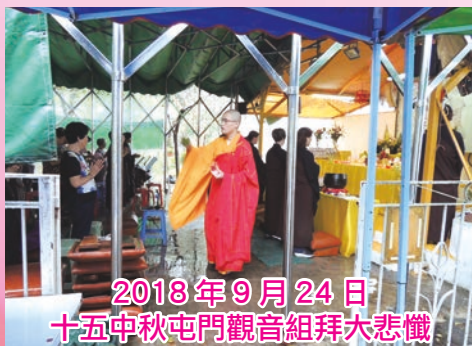
2018年9月24日 十五中秋屯門觀音組拜大悲懺