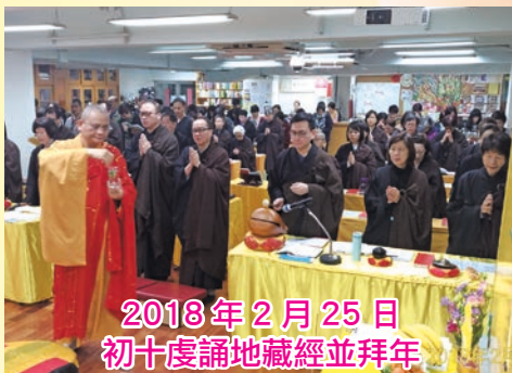
2018年2月25日 初十虔誦地藏經並拜年