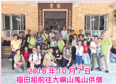
2018年10月7日 福田組前往大嶼山羌山供僧