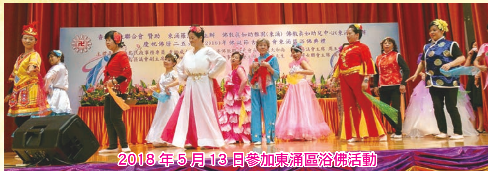
2018年5月13日參加東涌區浴佛活動