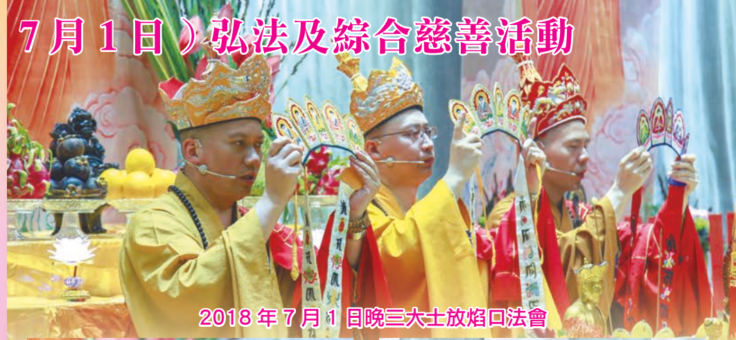
2018 年 7 月 1 日晚三大士放焰口法會