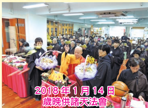
2018年1月14日 歲晚供諸天法會