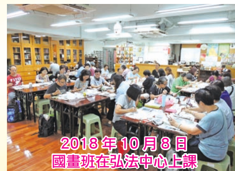
2018年10月8日 國畫班在弘法中心上課