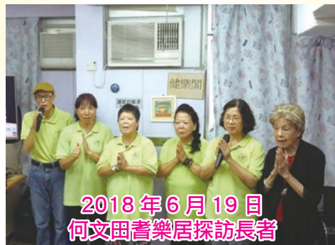
2018年6月19日 何文田耆樂居探訪長者