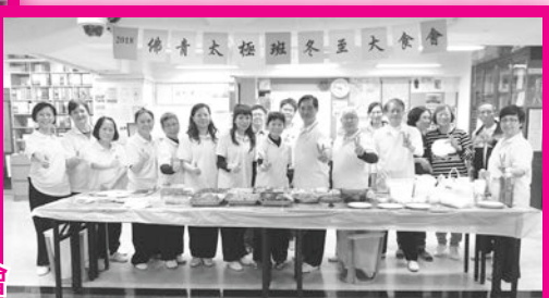
2018年12月15日太極班冬至大會