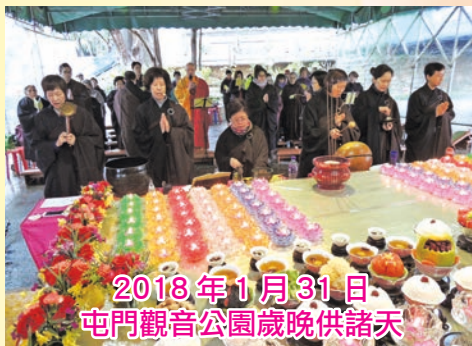
2018年1月31日 屯門觀音公園歲晚供諸天