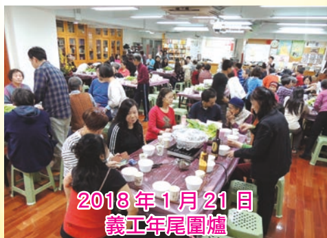
2018年1月21日 義工年尾圍爐