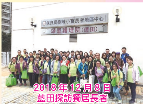
2018年12月8日 藍田探訪獨居長者