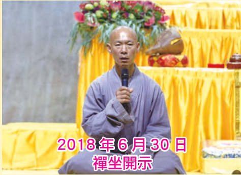
2018 年 6 月 30 日 禪坐開示