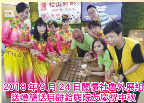
2018年9月24日關懷社會外展組 送燈籠送月餅給與院友慶祝中秋