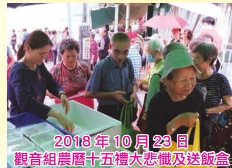
2018年10月23日 觀音組農曆十五禮大悲懺及送飯盒