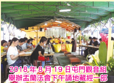
2018年8月19日屯門觀音組 舉辦盂蘭法會下午誦地藏經一部