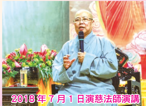
2018 年 7 月 1 日演慈法師演講