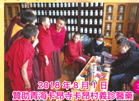
2018年8月1日 贊助青海卡昂寺卡昂村義診醫藥