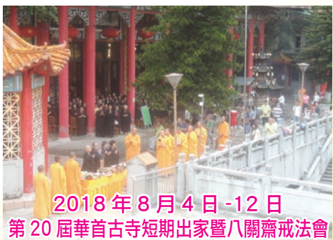
2018年8月4日-12日 第20屆華首古寺短期出家暨八關齋戒法會