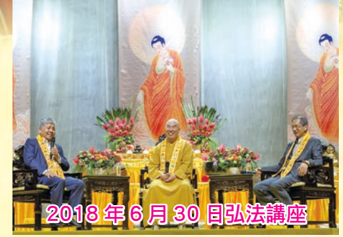
2018 年 6 月 30 日弘法講座