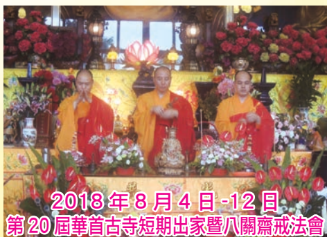
2018年8月4日-12日 第20屆華首古寺短期出家暨八關齋戒法會