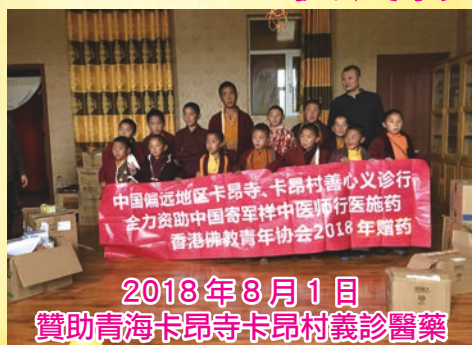
2018年8月1日 贊助青海卡昂寺卡昂村義診醫藥