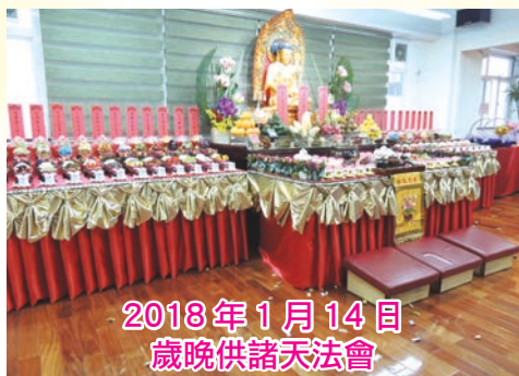
2018年1月14日 歲晚供諸天法會