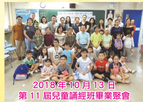
2018年10月13日 第11屆兒童誦經班畢業聚會