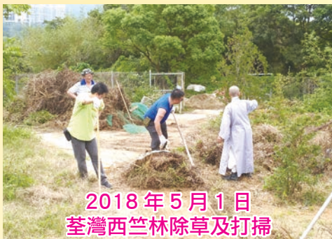
2018年5月1日 荃灣西竺林除草及打掃