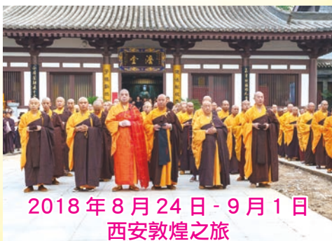
2018年8月24日-9月1日 西安敦煌之旅