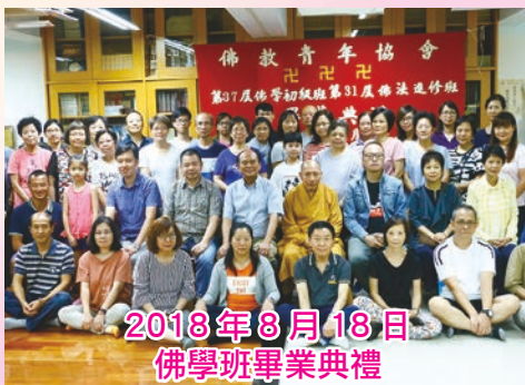
2018年8月18日 佛學班畢業典禮