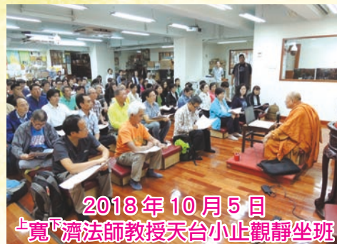
2018年10月5日 上寬下濟法師教授天台小止觀靜坐班