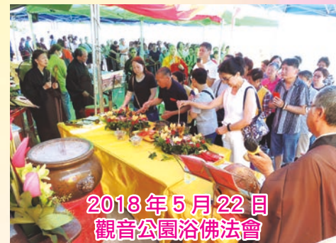
2018年5月22日 觀音公園浴佛法會