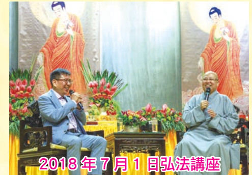
2018 年 7 月 1 日弘法講座