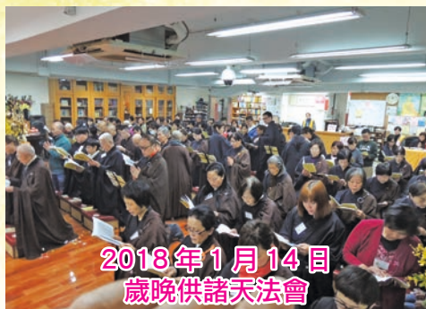
2018年1月14日 歲晚供諸天法會