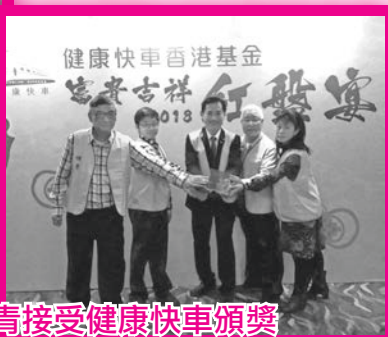
2018年1月1日太極班師傅代表佛青接受健康快車頒獎