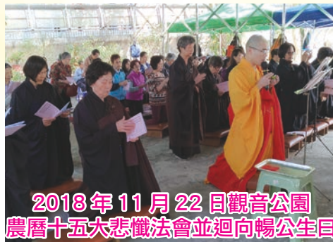
2018年11月22日觀音公園 農曆十五大悲懺法會並迴向暢公生日