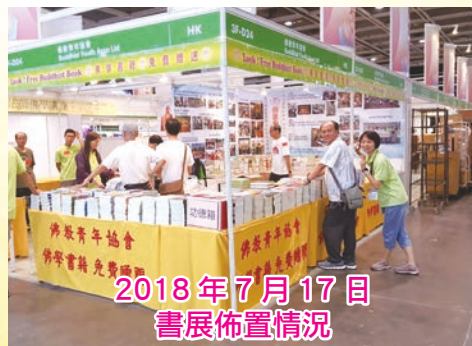
2018年7月17日 書展佈置情況