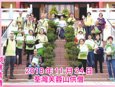
2018年11月24日 荃灣芙蓉山供僧