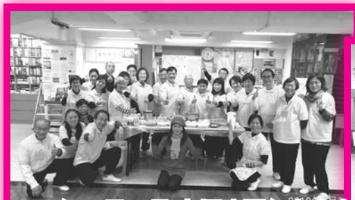
2018年2月3日太極班團年大會