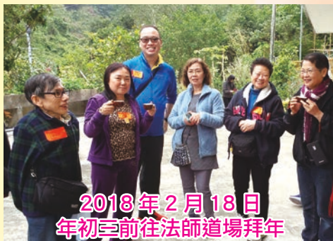
2018年2月18日 年初三前往法師道場拜年