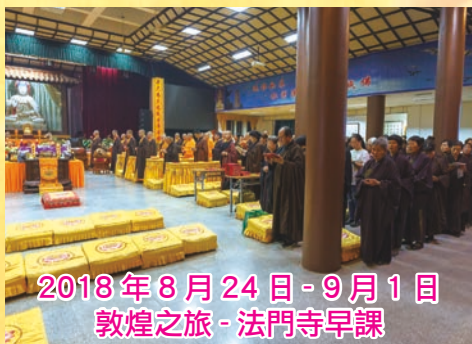
2018年8月24日-9月1日 敦煌之旅-法門寺早課