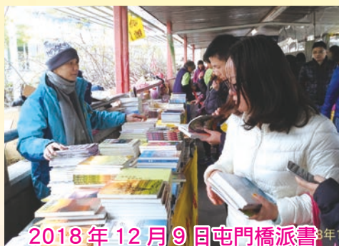
2018年12月9日屯門橋派書