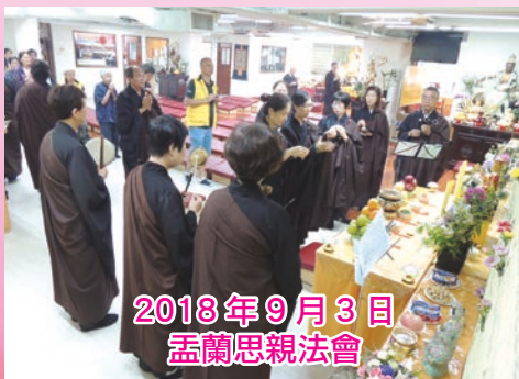
2018年9月3日 孟蘭思親法會