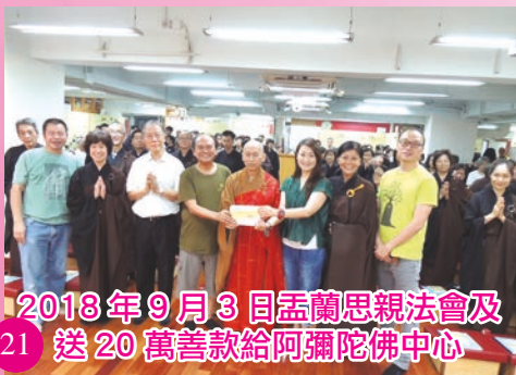
2018年9月3日孟蘭思親法會及 送20萬善款給阿彌陀佛中心