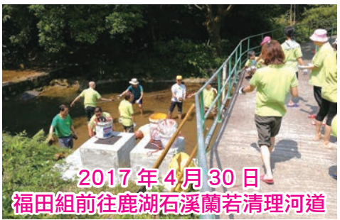
2017年4月30日 福田組前往鹿湖石溪蘭若清理河道