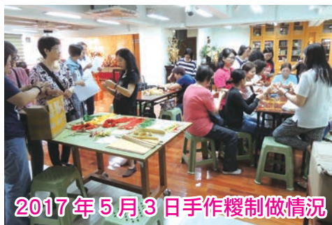
2017年5月3日手作糰制做情況