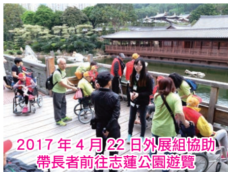
2017 年 4 月 22 日外展組協助 帶長者前往志蓮公園遊覽