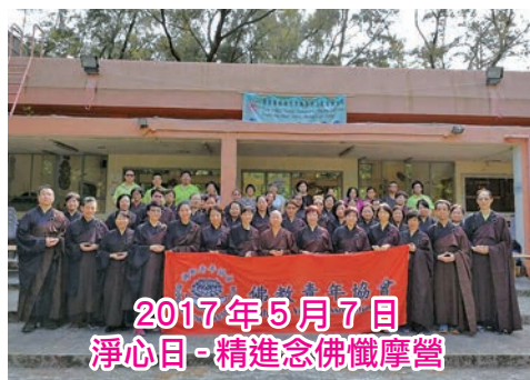
2017年5月7日 淨心日 - 精進念佛懺摩營