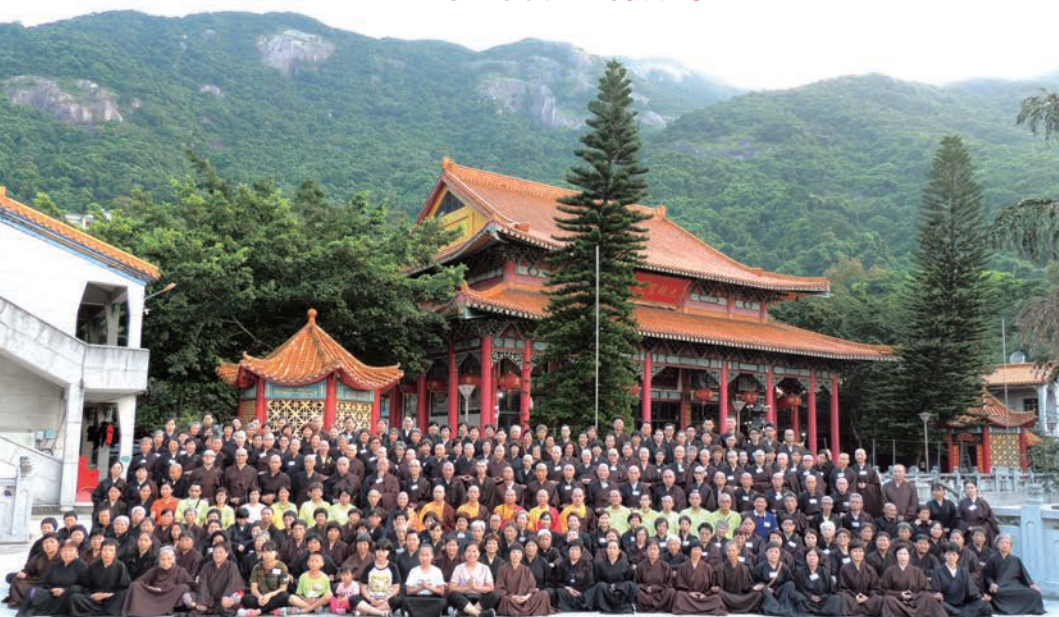
2017 年 8 月 5-13 日 第 19 屆於華首古寺舉辦短期出家及八關法會戒子及義工合照