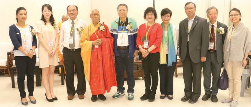
2017 年 4 月 30 日於圓明寺舉辦屯門區浴佛大典