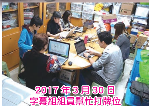
2017年3月30日 字幕組組員幫忙打牌位