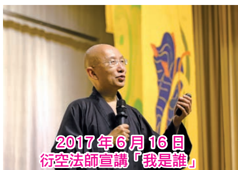
2017年6月16日 衍空法師宣講「我是誰」