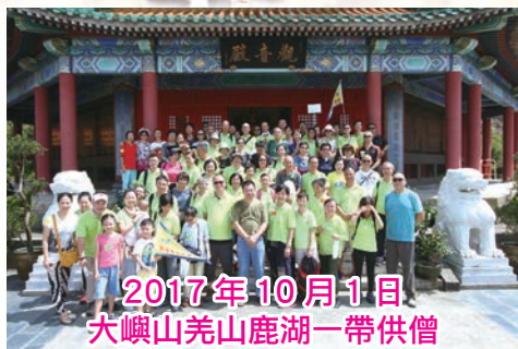
2017年10月1日 大嶼山羌山鹿湖一帶供僧