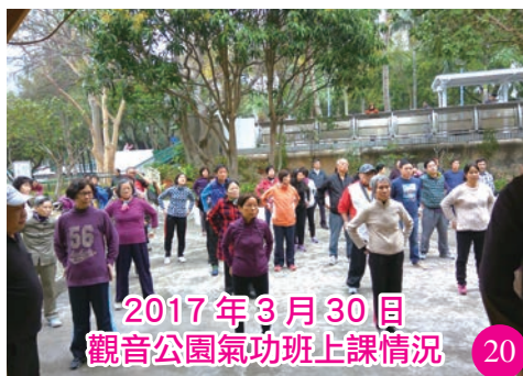
2017年3月30日 觀音公園氣功班上課情況