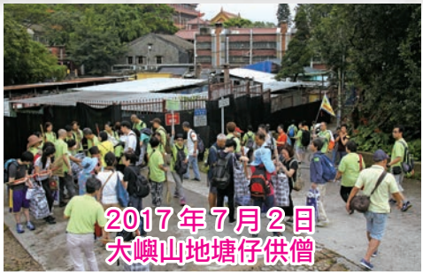
2017年7月2日 大嶼山地塘仔供僧