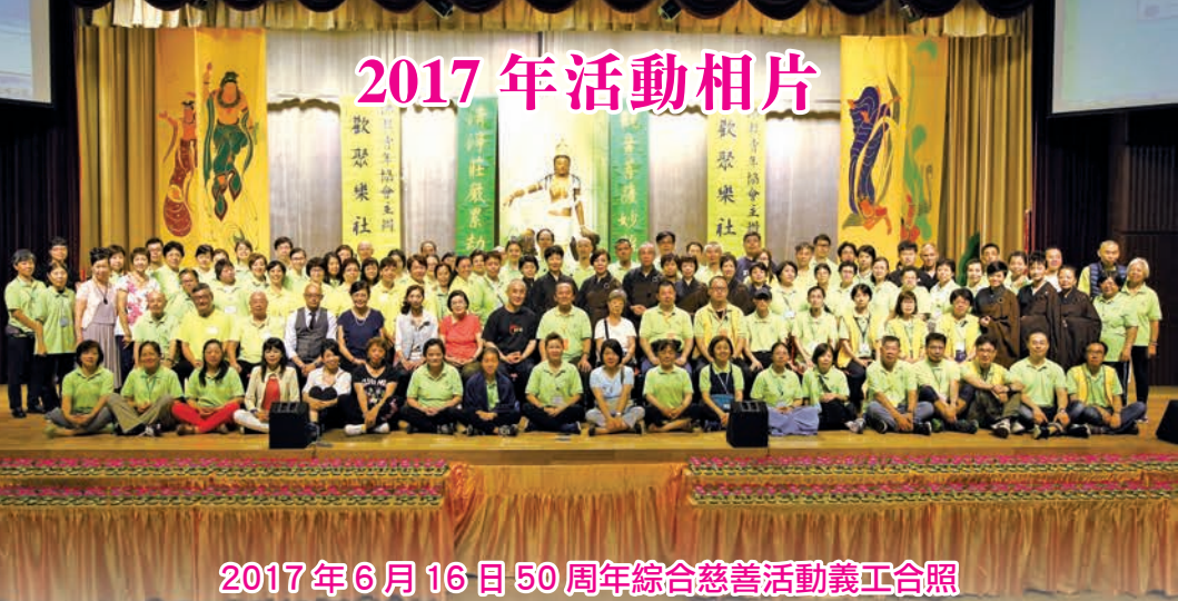
2017年6月16日50周年綜合慈善活動義工合照