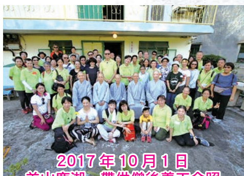
2017 年 10 月 1 日 羌山鹿湖一帶供僧後義工合照