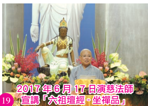
2017年6月17日演慈法師 宣講「六祖壇經-坐禪品」