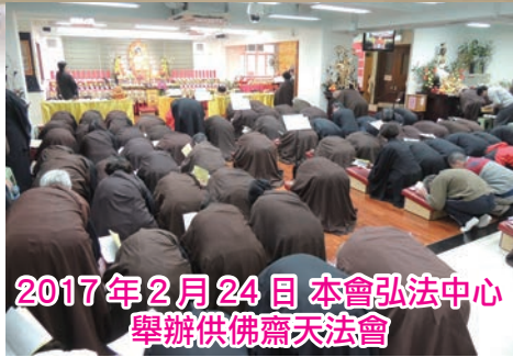
2017年2月24日 本會弘法中心 舉辦供佛齋天法會