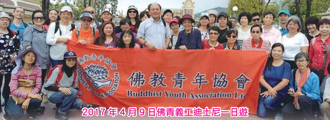
2017年4月9日佛青義工迪士尼一日遊