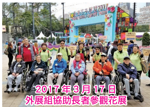
2017年3月17日 外展組協助長者參觀花展