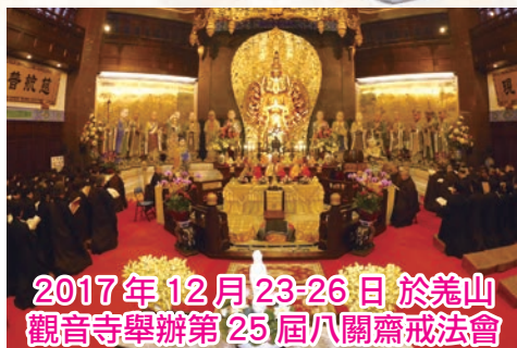
2017年12月23-26日 於羌山 觀音寺舉辦第25屆八關齋戒法會