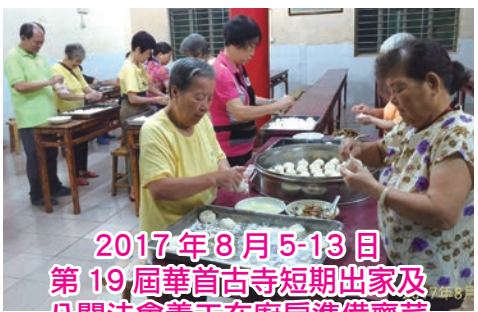
2017年8月5-13日 第19屆華首古寺短期出家及 八關法會義工在廚房準備齋菜