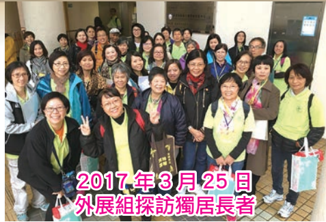
2017年3月25日 外展組探訪獨居長者