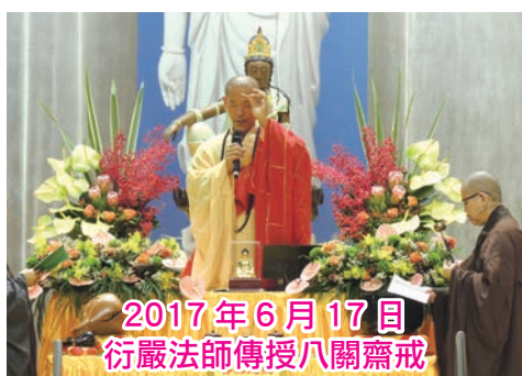
2017年6月17日 衍嚴法師傳授八關齋戒