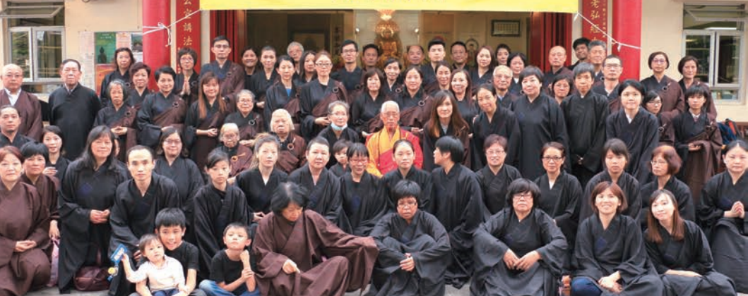
2017年11月5日 於天台精舍舉辦觀音誕法會及第182屆傳授三皈依大典