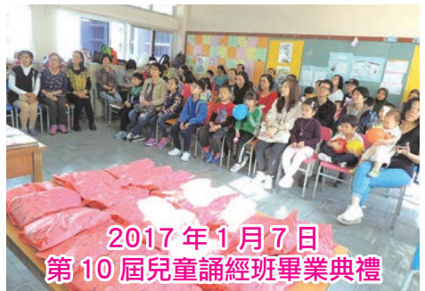
2017年1月7日 第10屆兒童誦經班畢業典禮