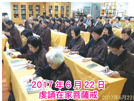
2017 年 6 月 22 日 虔誦在家菩薩戒