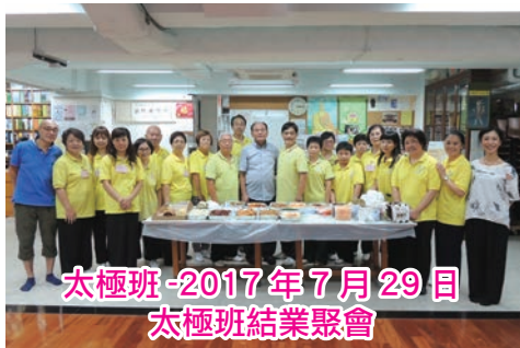
太極班-2017年7月29日 太極班結業聚會