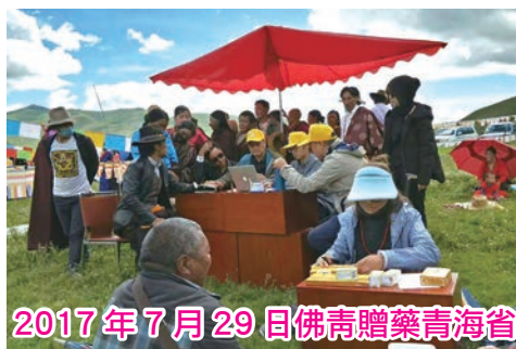
2017年7月29日佛青贈藥青海省