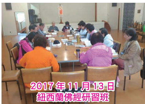
2017年11月13日紐西蘭佛經研習班