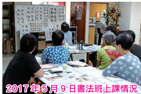
2017年5月9日書法班上課情況