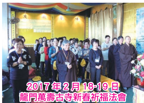
2017年2月18-19日龍門萬壽古寺新春祈福法會