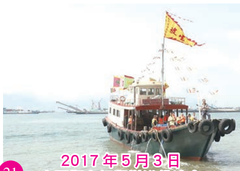
2017 年 5 月 3 日 屯門觀音組舉辦浴佛法會