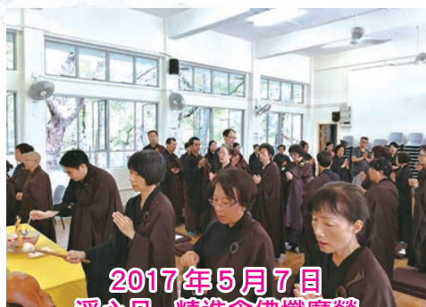
2017 年 5 月 7 日 淨心日 - 精進念佛懺摩營