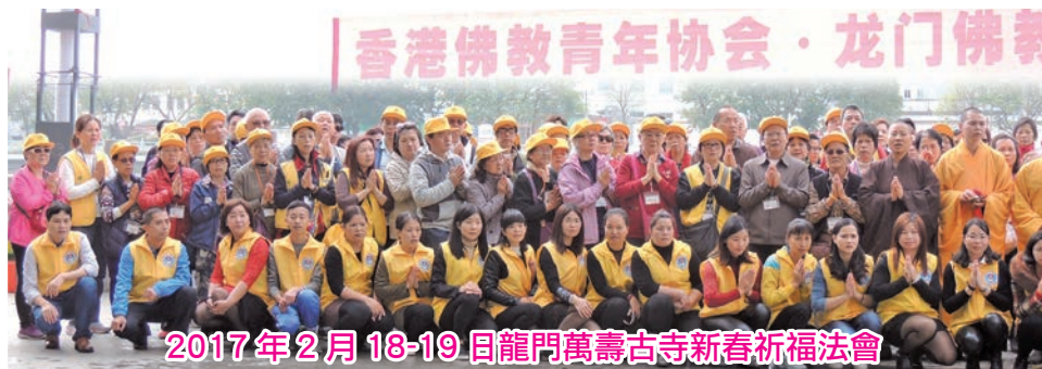
2017年2月18-19日龍門萬壽古寺新春祈福法會