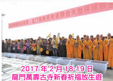
2017年2月18-19日 龍門萬壽古寺新春祈福放生遊