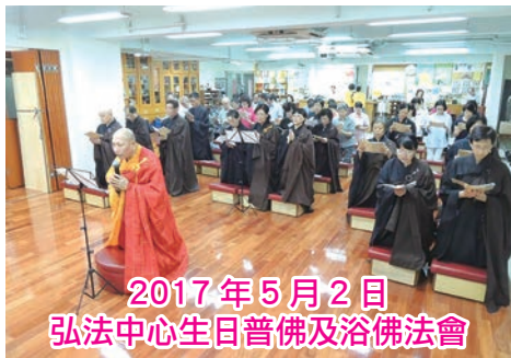
2017年5月2日 弘法中心生日普佛及浴佛法會