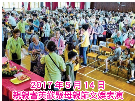
2017 年 5 月 14 日 親親耆英歡聚母親節文娛表演