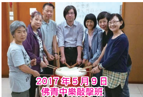
2017年5月9日 佛青中樂敲擊班