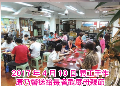
2017年4月10日 義工手作 康乃馨送給長者歡度母親節