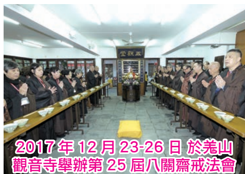
2017年12月23-26日於羗山 觀音寺舉辦第25屆八關齋戒法會