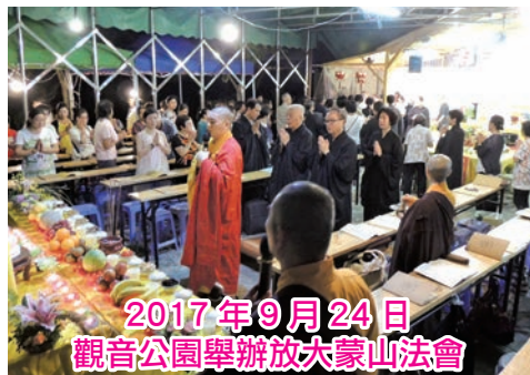
2017年9月24日 觀音公園舉辦放大蒙山法會