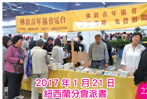
2017年1月21日 紐西蘭分會派書