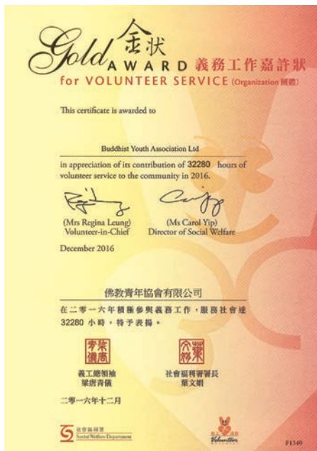
社會福利署頒發本會 32,280 小時義務工作嘉許狀