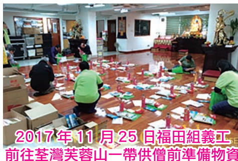
2017年11月25日福田組義工 前往荃灣芙蓉山一帶供僧前準備物資