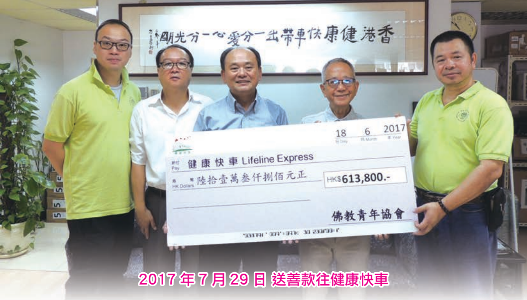
2017年7月29日 送善款往健康快車