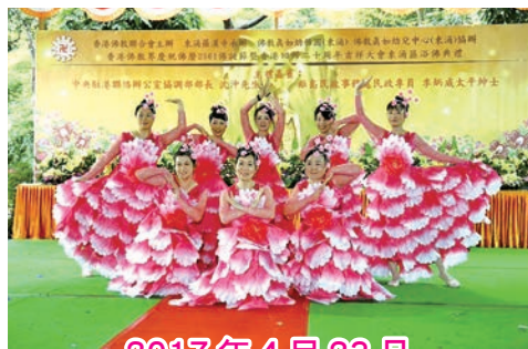
2017 年 4 月 23 日 東涌區浴佛大典舞蹈組表演