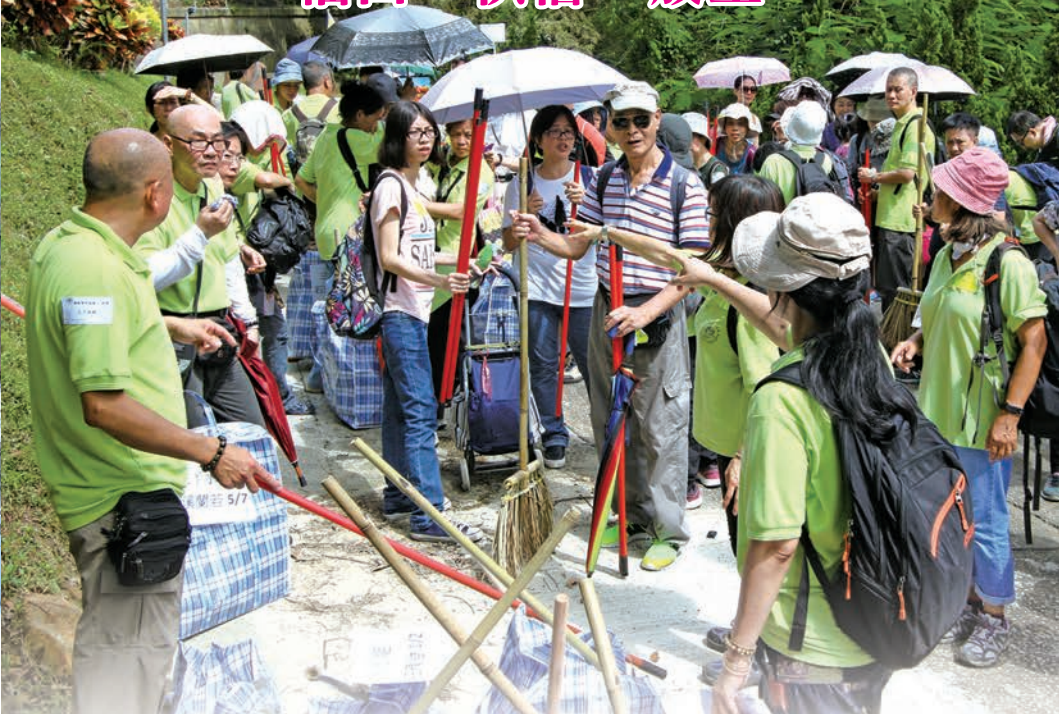
2017年10月1日大嶼山羌山鹿湖一帶供僧