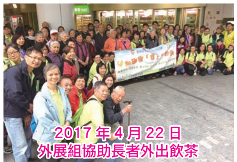
2017年4月22日 外展組協助長者外出飲茶