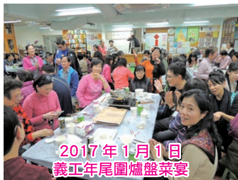
2017 年 1 月 1 日 義工年尾圍爐盤菜宴