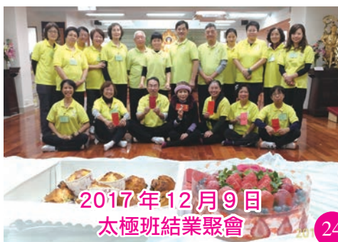
2017年12月9日 太極班結業聚會