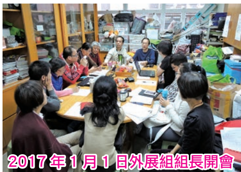
2017年1月1日 外展組組長開會