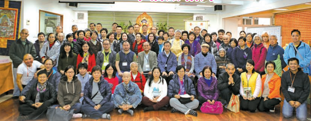
2017年3月26日第50屆會員大會暨迎新日-會員大合照