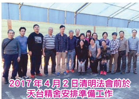
2017年4月2日清明法會前於天台精舍安排準備工作