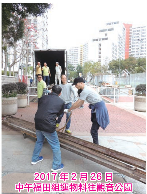
2017年2月26日 中午福田組運物料往觀音公園