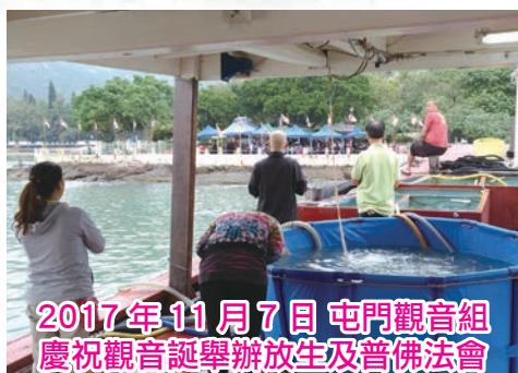
2017年11月7日 屯門觀音組 慶祝觀音誕舉辦放生及普佛法會