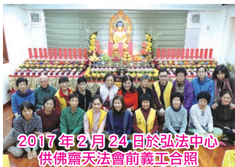
2017年2月24日於弘法中心 供佛齋天法會前義工合照