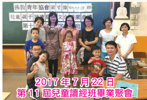
2017年7月22日 第11屆兒童讀經班畢業聚會