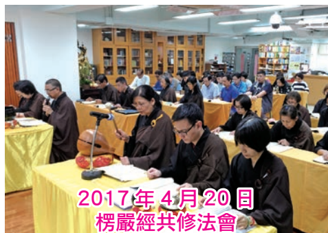
2017年4月20日 楞嚴經共修法會