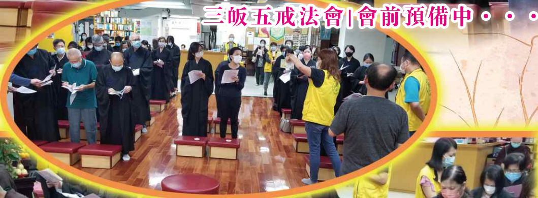
三皈五戒法會 | 會前預備中