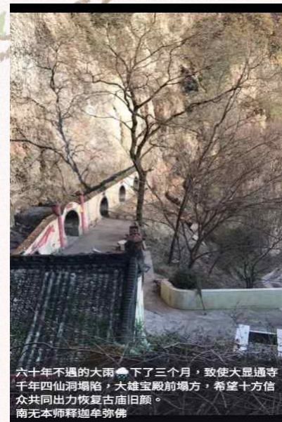
六十年不遇的大雨下了三个月，致使大显通寺千年四仙洞塌陷，大雄宝殿前塌方，希望十方信众共同出力恢复古庙旧颜。南无本师释迦牟尼佛