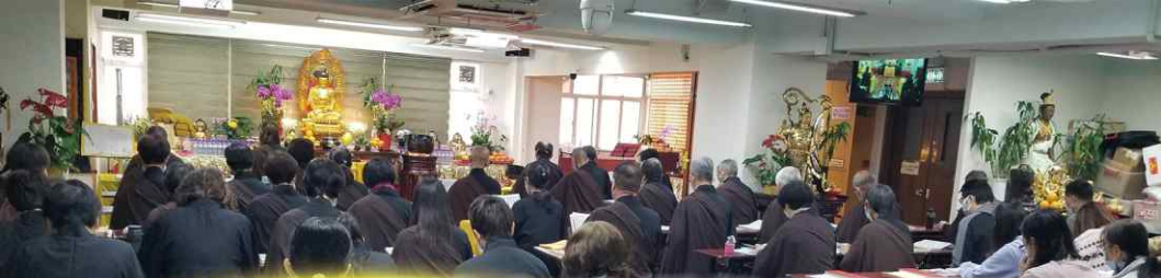
弘法中心 星期日地藏經法會