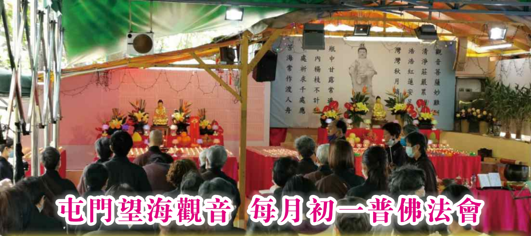
屯門望海觀音 每月初一普佛法會