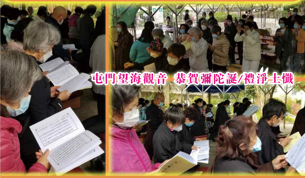
屯門望海觀音 恭賀彌陀誕/禮淨土懺