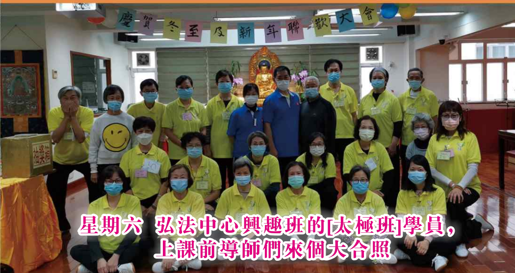
星期六 弘法中心興趣班的[太極班]學員， 上課前導師們來個大合照