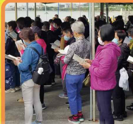
2021年10月24日 屯門觀音公園慶祝觀音誕， 舉辦放生/禮大悲懺/傳授三皈五戒法會。