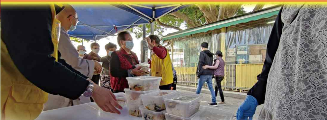
逢每月初一 [普佛法會] 後免費 送贈|素飯盒/生果|與眾結緣