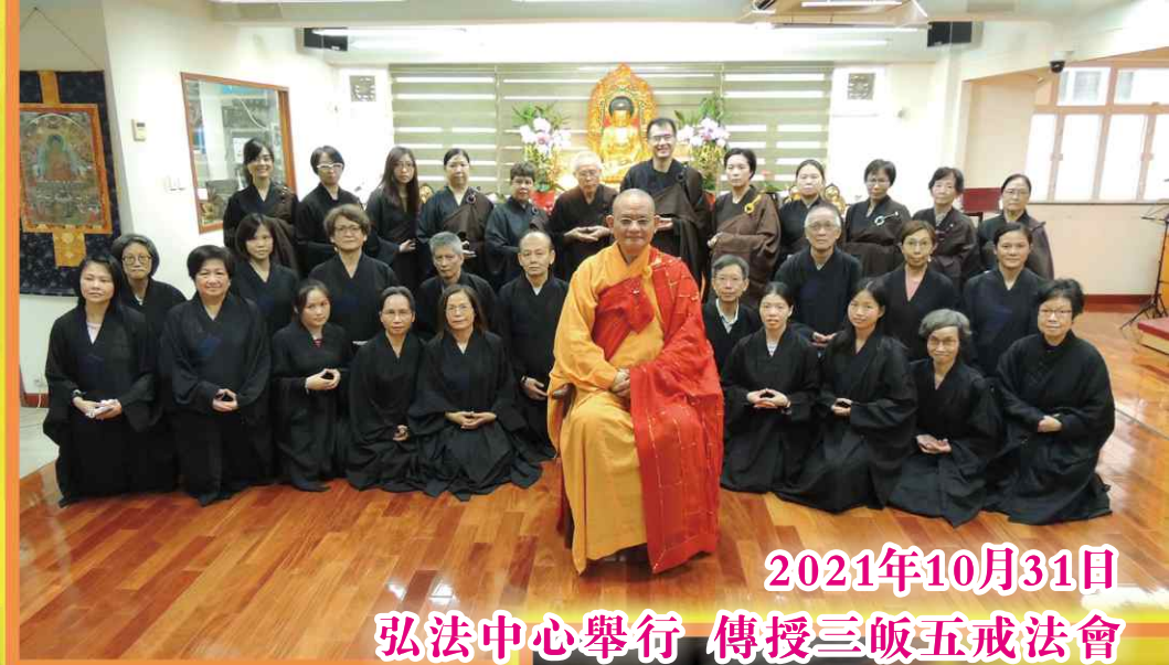
2021年10月31日 弘法中心舉行 傳授三皈五戒法會