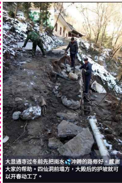
大显通寺过冬前先把雨水冲刷的路修好。感谢大家的帮助。四仙洞前塌方，大殿后的护坡就可以开春动工了。

二零二一年冬，大顯通寺給近三個月不斷的雨水灌洗濯使寺院旁的山體滑坡，阻塞道路，大殿前方下陷，水管破裂。最為嚴重的是千年四仙洞前塌方，令人心痛！現在要清理道路，四仙洞和大殿需要護坡。