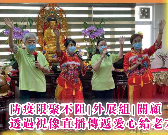
防疫限聚不阻|外展組|關顧“老友記” 透過視像直播傳遞愛心給老友記們