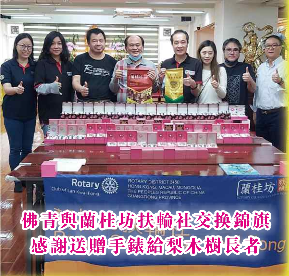
佛青與蘭桂坊扶輪社交換錦旗 感謝送贈手錶給梨木樹長者