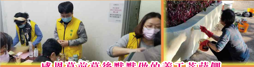
感恩幕前幕後默默做的義工菩薩們