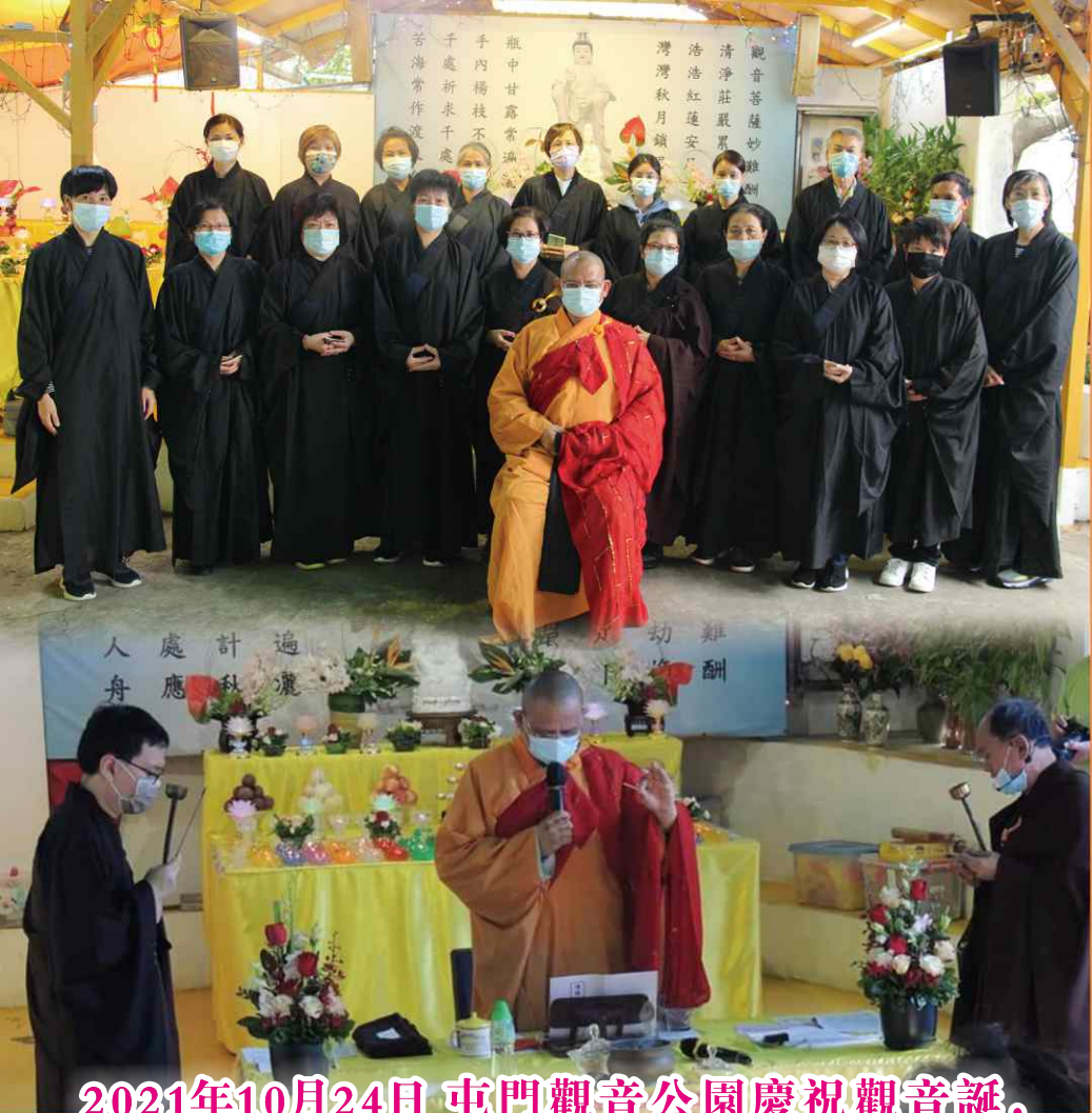
2021年10月24日 屯門觀音公園慶祝觀音誕， 舉辦放生/禮大悲懺/傳授三皈五戒法會。