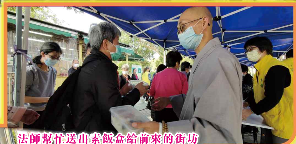
法師幫忙送出素飯盒給前來的街坊