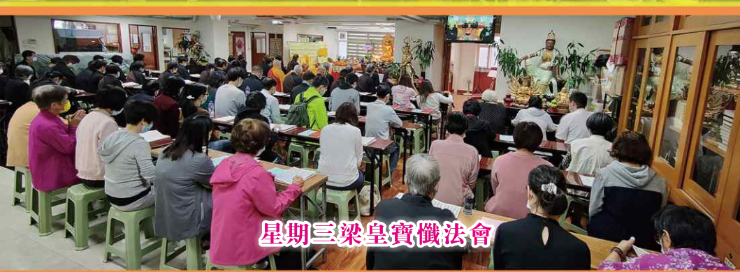
星期三梁皇寶懺法會