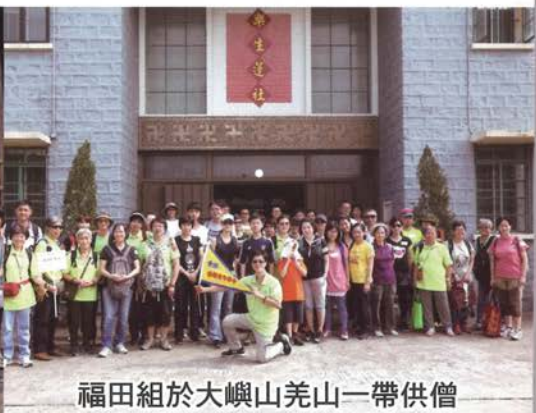
福田組於大嶼山羌山一帶供僧