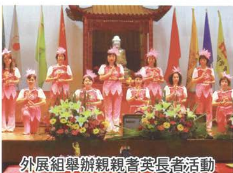
外展組舉辦親親耆英長者活動