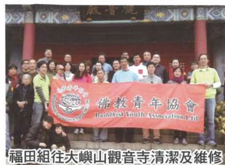
福田組往大嶼山觀音寺清潔及維修