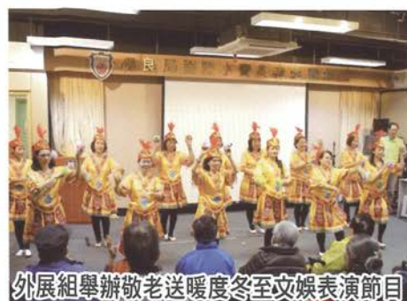
外展組舉辦敬老送暖度冬至文娛表演節目