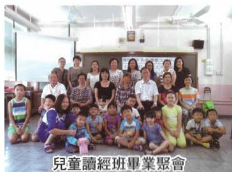
兒童讀經班畢業聚會