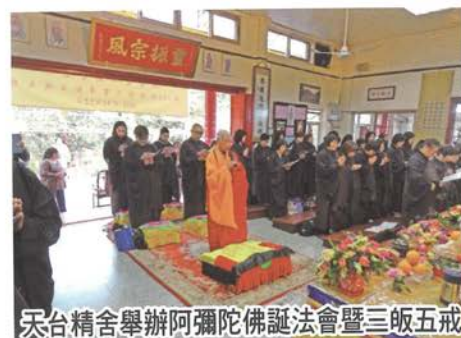
天台精舍舉辦阿彌陀佛誕法會暨三皈五戒