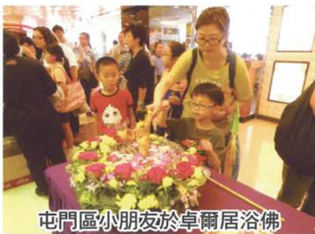
屯門區小朋友於卓爾居浴佛