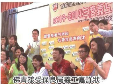
佛青接受保良局義工嘉許狀