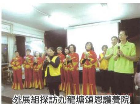
外展組探訪九龍塘頌恩護養院