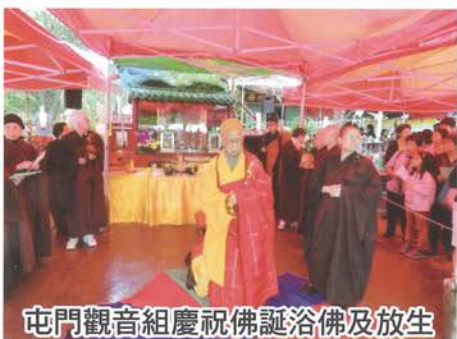
屯門觀音組慶祝佛誕浴佛及放生