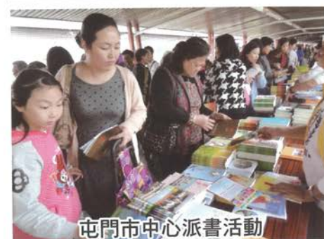
屯門市中心派書活動