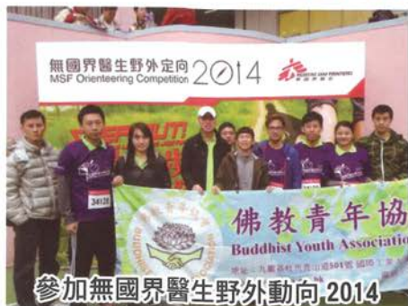
參加無國界醫生野外定向, 2014