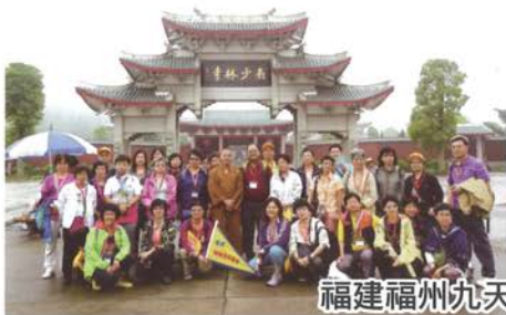
福建福州九天朝聖遊—南少林