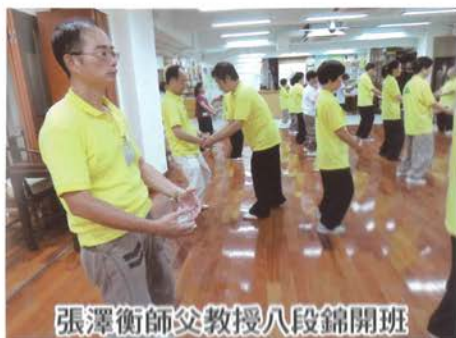
張澤衡師父教授八段錦開班