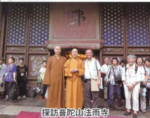
探訪普陀山法雨寺