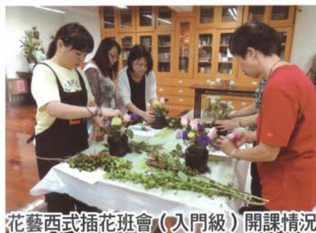
花藝西式插花班會(入門級)開課情況