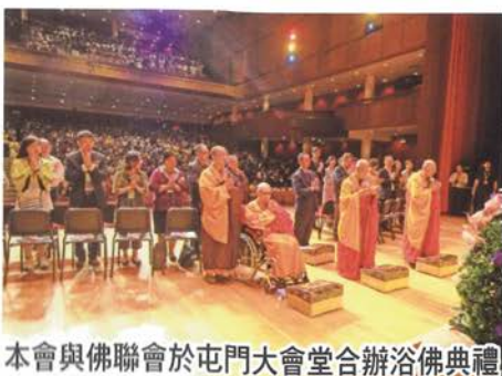
本會與佛聯會於屯門大會堂合辦浴佛典禮