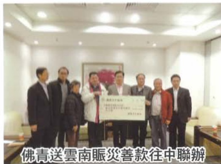
佛青送雲南賑災善款往中聯辦