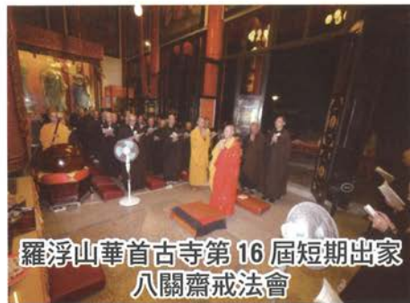
羅浮山華首古寺第16屆短期出家 八關齋戒法會