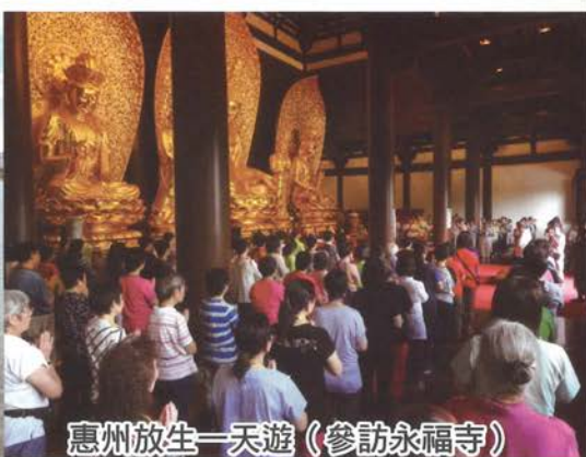
惠州放生一天遊 (參訪永福寺)