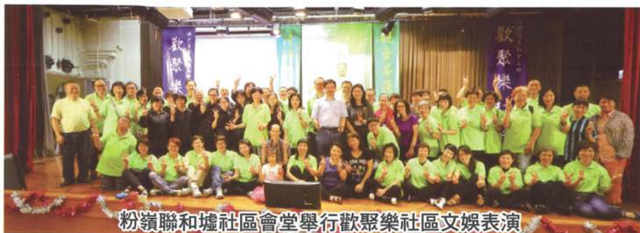
粉嶺聯和墟社區會堂舉行歡聚樂社區文娛表演