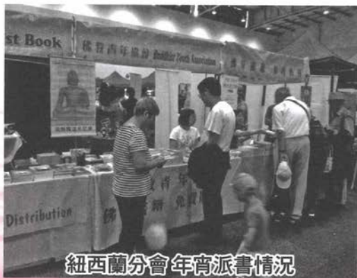
紐西蘭分會年宵派書情況

P.O. BOX 82146, HIGHLAND PARK, HOWICK, AUCKLAND, NEW ZEALAND