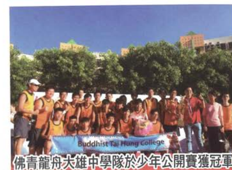
佛青龍舟夫雄中學隊於少年公開賽獲冠軍