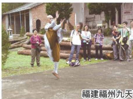
福建福州九天朝聖遊—南巖禪寺