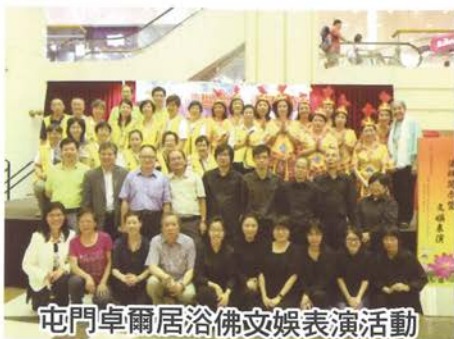
屯門卓爾居浴佛文娛表演活動