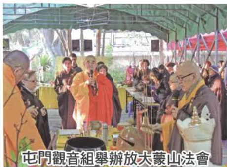
屯門觀音組舉辦放大蒙山法會