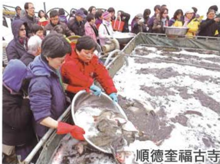
順德奎福古寺新春祈福放生遊