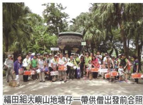
福田組大嶼山地塘仔一帶供僧出發前合照