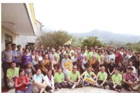
福田組往大嶼山石溪蘭若打掃後合照