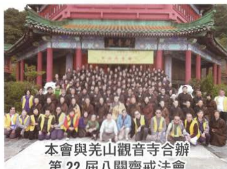
本會與羌山觀音寺合辦 第22屆八關齋戒法會