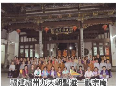
福建福州九天朝聖遊—觀宗庵