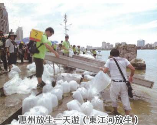
惠州放生一天遊 (東江河放生)