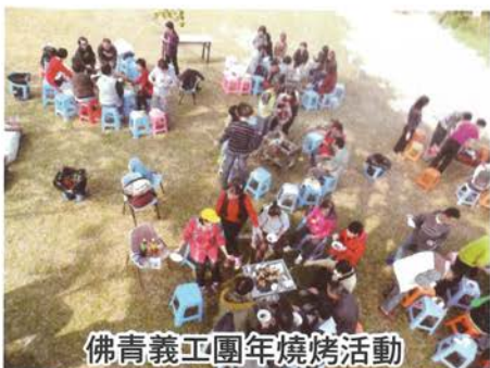
佛青義工團年燒烤活動