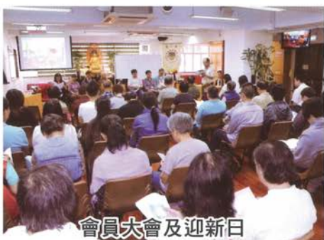
會員大會及迎新日