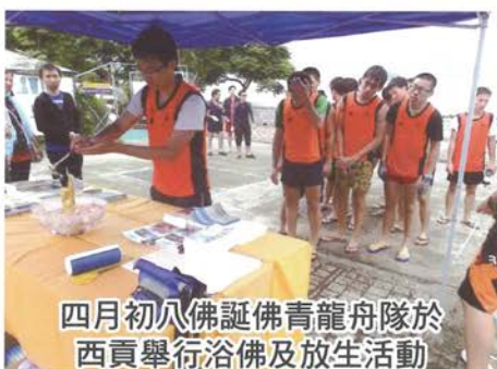
四月初八佛誕佛青龍舟隊於西貢舉行浴佛及放生活動