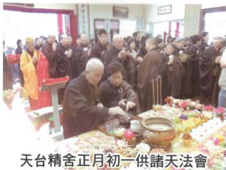
天台精舍正月初一供諸天法會