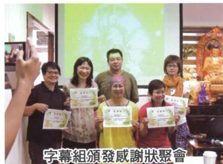
字幕組頒發感謝狀聚會