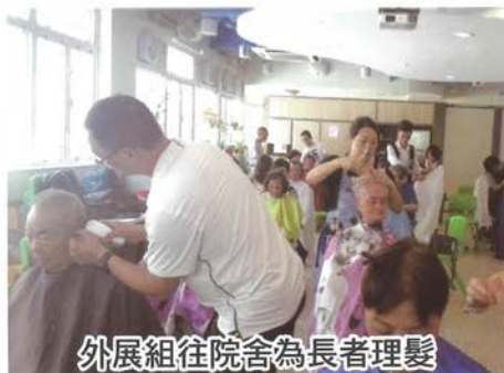
外展組往院舍為長者理髮