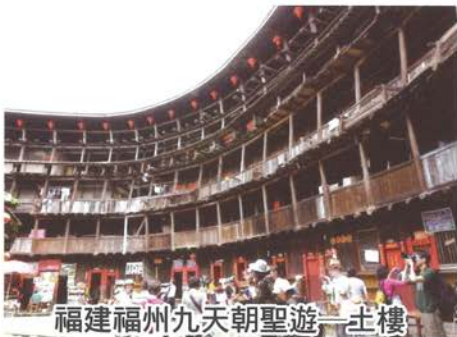
福建福州九天朝聖遊—土樓