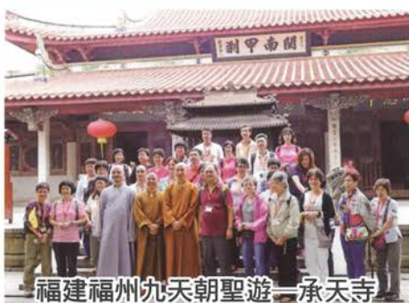
福建福州九天朝聖遊—承天寺