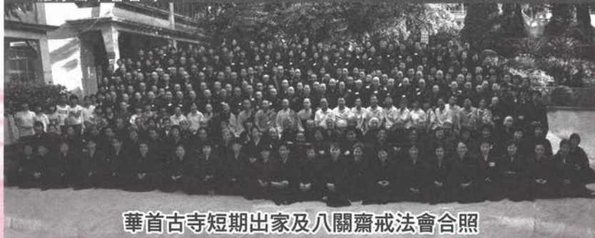
華首古寺短期出家及八關齋戒法會合照