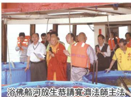
浴佛船河放生恭請寬濟法師主法