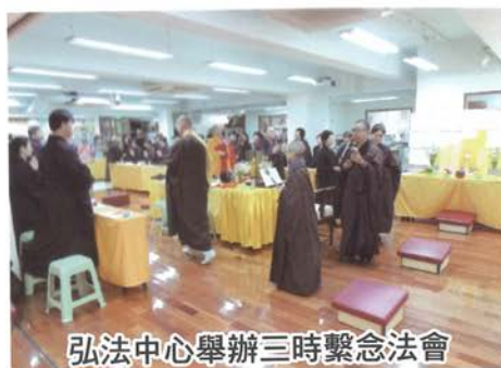
弘法中心舉辦三時繫念法會