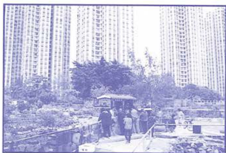
屯門蝴蝶灣望海觀音廟