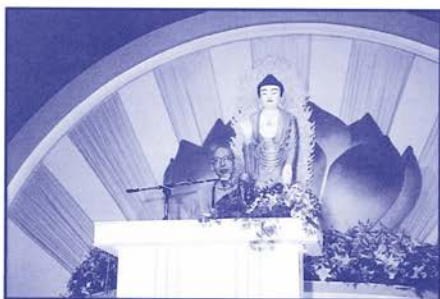
聖嚴法師佛學講座