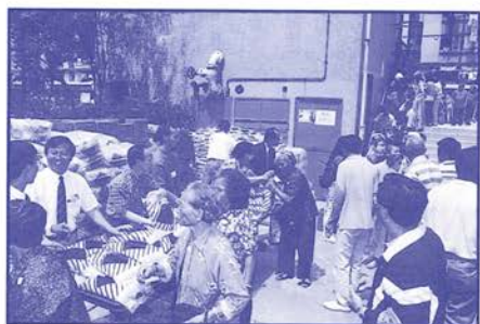
浴佛節敬老派送米油

本會五月八日於石硤尾澤安村舉行浴佛典禮暨敬老濟貧活動。先舉行浴佛典禮，並後送贈米油等與老年或清貧人士，共用港幣十一萬三千三百五十三元一角正。