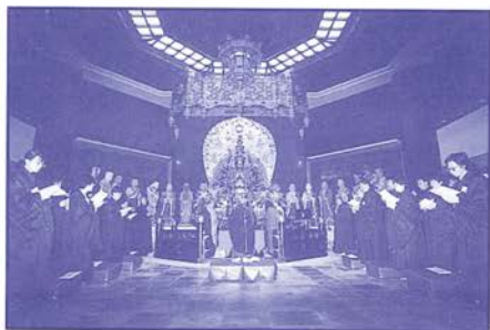
本會與蘆山觀音寺合辦八關齋戒