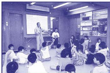
暑期兒童佛學班上課情形

本會於七、八月間舉辦暑期兒童佛學班，藉此培養兒童對佛法認識及興趣，在身心的成長中種下深厚善根，啟發心靈的智慧，為將來接受教育及進入社會奠下良好的基礎