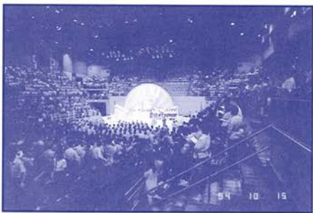
聖嚴法師佛學講座