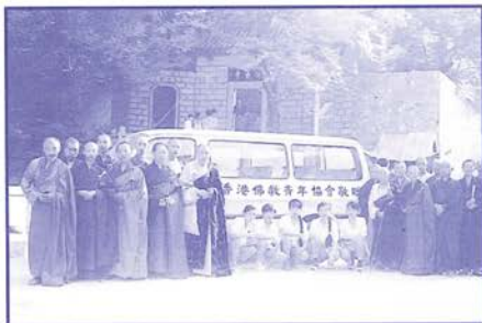
捐贈小巴與桐柏山

九四年中，本會再籌港幣281,700，購買小巴一部贈送給水簾寺兼負緊急接載僧尼責任；扣除購買小巴費用後，餘款作供僧用途。