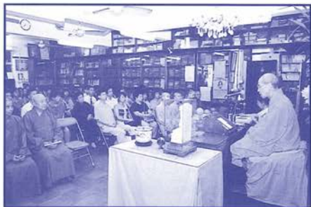
仁俊法師宣說佛法

香港禪中心主辦，佛教青年協會協辦，禮請 崇山禪師宣講「心經」四天，於溫莎公爵社會服務大廈大禮堂舉行。