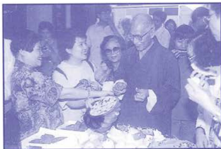
天台精舍中秋晚會