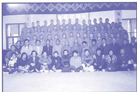
觀宗庵佛學苑第二屆畢業典禮

福建省福安市觀宗庵舉辦佛教培訓班乃專為培訓青年學僧，本會每月定期供養經費人民幣6,500元，由十一月開始，每月定期供養經費增加至人民幣8,600元