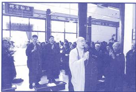
倭虛大師圓寂三十一週年追思法會