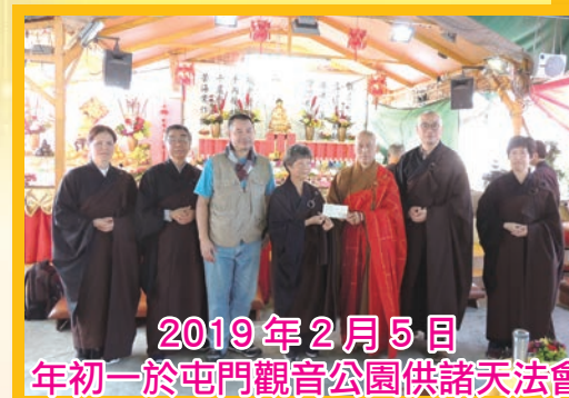
2019年2月5日 年初一於屯門觀音公園供諸天法會