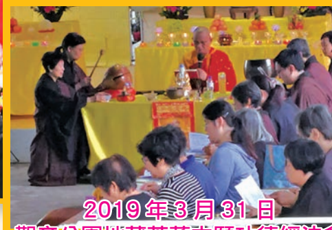
2019年3月31日 觀音公園地藏菩薩本願功德經法會