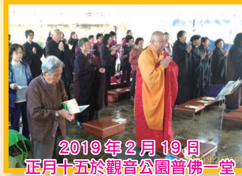
2019年2月19日 正月十五於觀音公園普佛一堂