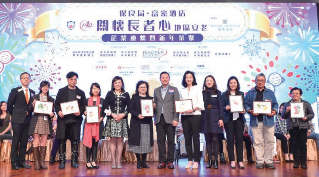
2019年1月9日本會參與保良局 機場酒店「關懷長者心」新年茶聚 並獲頒感謝狀