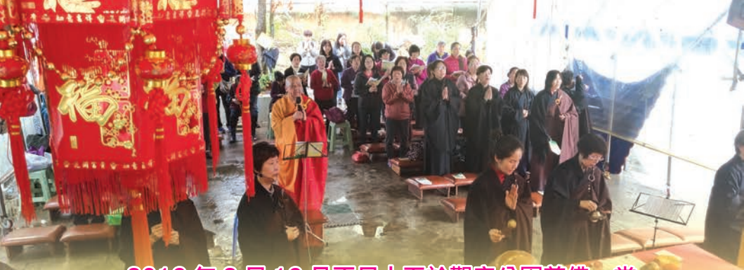
2019年2月19日正月十五於觀音公園普佛一堂 (恭請演亮法師主法)