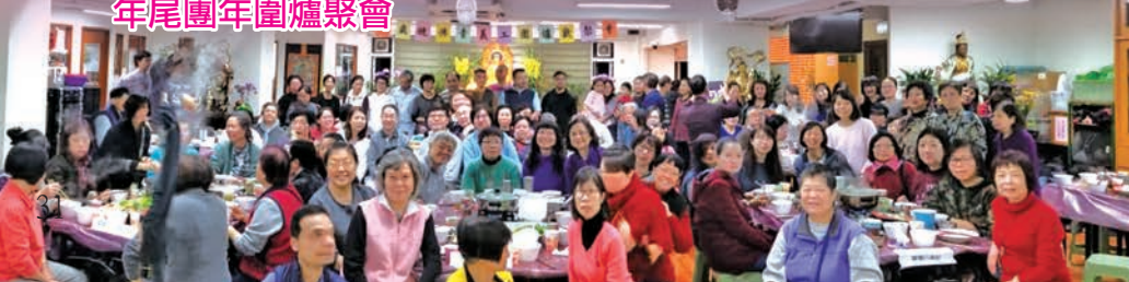
2019年1月1日 年尾團年圍爐聚會