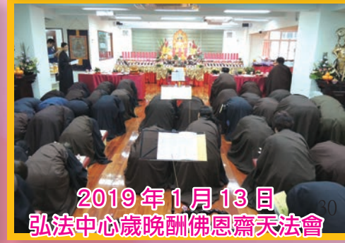
2019年1月13日 弘法中心歲晚酬佛恩齋天法會