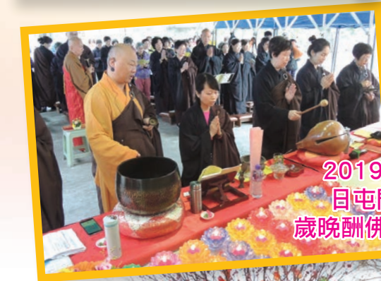
2019年1月20日 屯門觀音公園 歲晚酬佛恩供諸天法會

2019年2月5日 年初一於屯門觀音 公園供諸天法會 送交 $100,000 善款支票給 阿彌陀佛中心