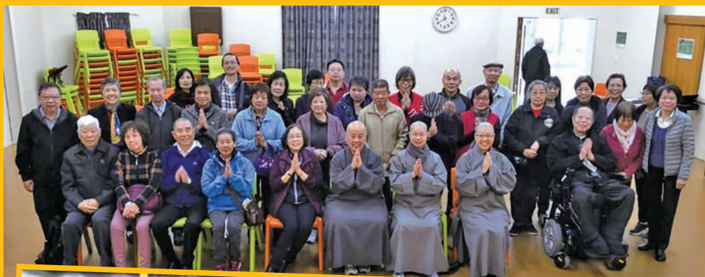
紐西蘭佛學講座後團體合照