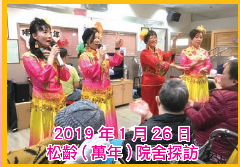
2019年1月26日 松齡(萬年)院舍探訪