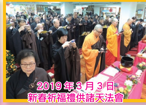
2019年3月3日 新春祈福禮供諸天法會