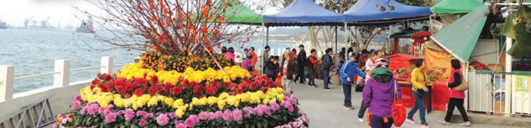
2019年2月5日年初一觀音公園善信祈福許願