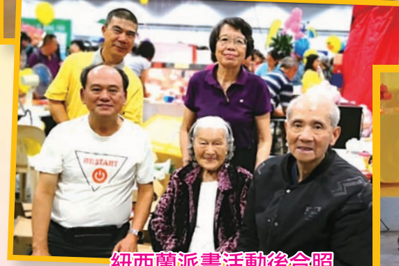
紐西蘭派書活動後合照