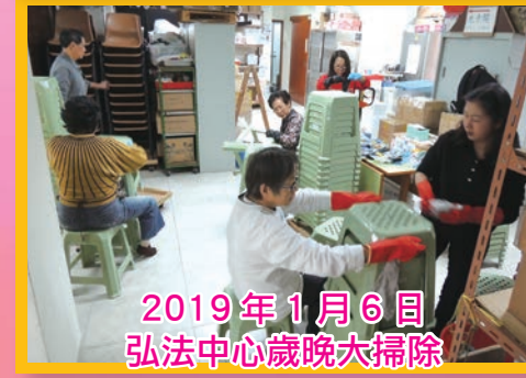
2019年1月6日 弘法中心歲晚大掃除