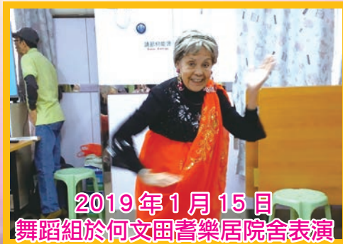
2019年1月15日 舞蹈組於何文田耆樂居院舍表演