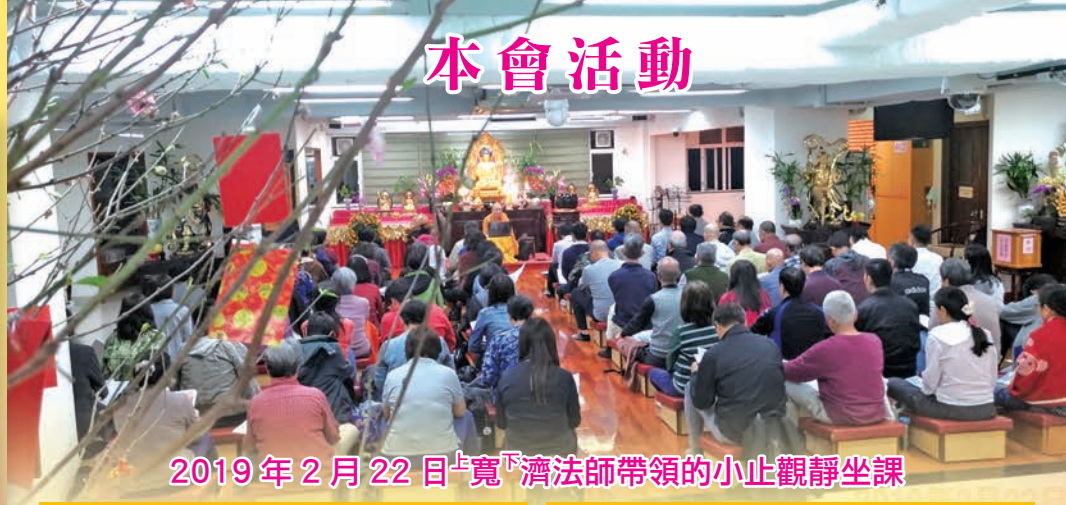
2019年2月22日 上寬下濟法師帶領的小止觀靜坐課