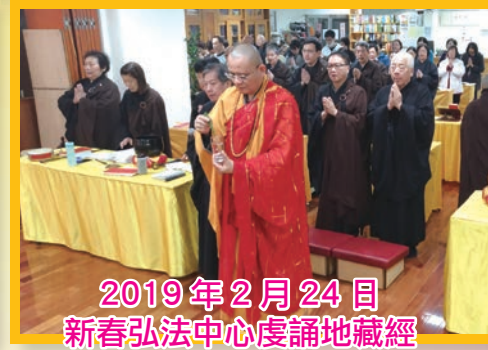
2019年2月24日 新春弘法中心虔誦地藏經