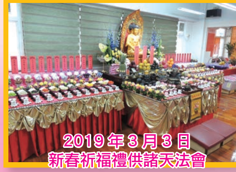
2019年3月3日 新春祈福禮供諸天法會