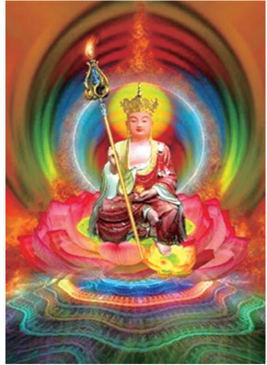
地藏菩薩本願經·覺林菩薩偈

譬如工畫師·分布諸彩色·虛妄取異相·大種無差別 大種中無色·色中無大種·亦不離大種·而有色可得 心中無彩畫·彩畫中無心·然不離於心·有彩畫可得 彼心恒不住·無量難思議·示現一切色·各各不相知 譬如工畫師·不能知自心·而由心故畫·諸法性如是 心如工畫師·能畫諸世間·五蘊悉從生·無法而不造 如心佛亦爾·如佛眾生然·應知佛與心·體性皆無盡 若人知心行·普造諸世間·是人則見佛·了佛真實性 心不住於身·身亦不住心·而能作佛事·自在未曾有 若人欲了知·三世一切佛·應觀法界性·一切唯心造