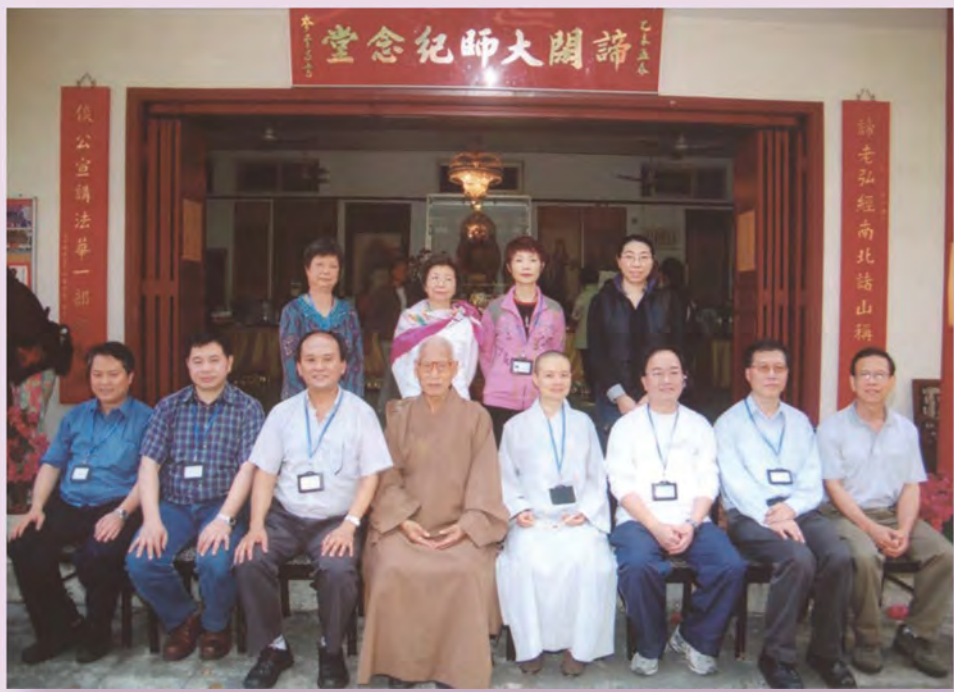
二〇〇七年第四十屆董事局成員