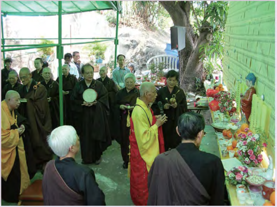
荷石精舍清明法會